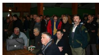
Vendeurs et acheteurs de bois attendront en vain.

L'intersyndicale de l'ONF a de nouveau empêché la vente de bois de Pontarlier à Levier. Les communes privées de ressources et les scieurs s'indignent !