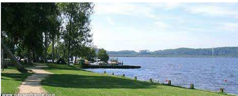
Le lac de LEON à 900m de la MF