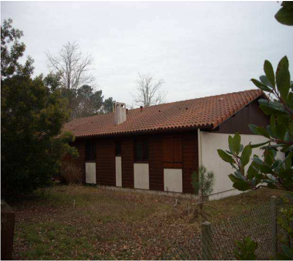
Côté route du lac