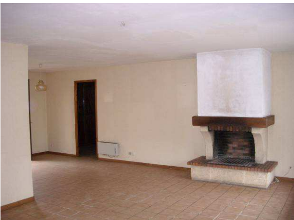
Salle de séjour

2- La MF avoisine les 140 m 2 habitable : 1 séjour de 45 m 2 avec cheminée – 2 chambres couples + 1 chambre enfants où l'on peut mettre sans problème 3 lits superposés + 1 bureau transformable en chambre d'appoint + 1 garage + 1 jardin. Accès possible handicapés. Habitable sans frais sauf rafraîchissement de la cuisine!